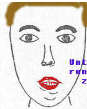
Unterlippe runter ziehen