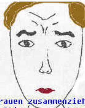
Augenbrauen zusammenziehen und Stirn krausen