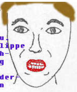
Ober u. Unterlippe gleichzeitig auseinander ziehen