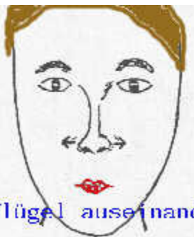
Nasenflügel auseinander ziehen