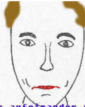
Lippen aufeinander pressen