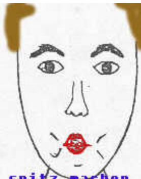
Mund spitz machen