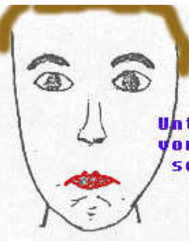
Unterlippe vor schieben