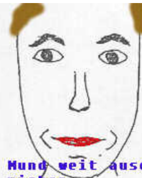
Mund weit auseinander ziehen