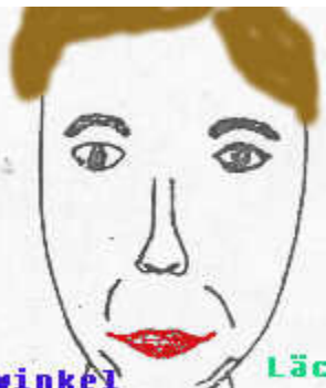
Mundwinkel nach oben ziehen